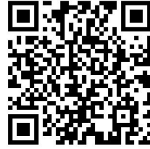
工信权力事项清单